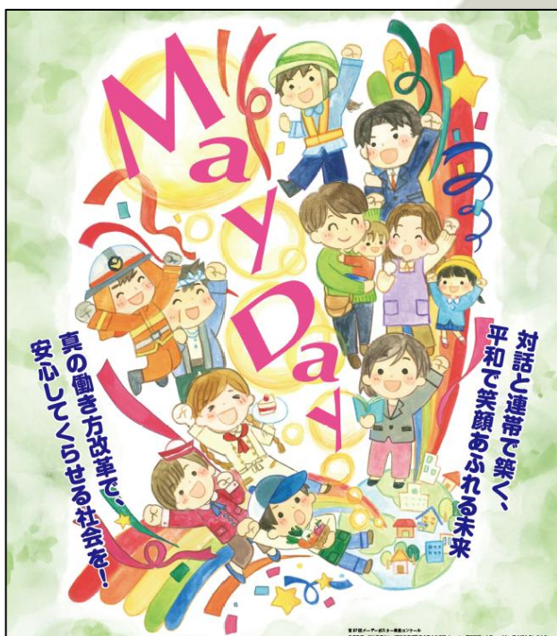
【第97回メーデーポスター】

横手湯沢地協/湯沢雄勝地区 湯沢市・中央公園野外音楽堂 4月29日(水・祝) 9:30