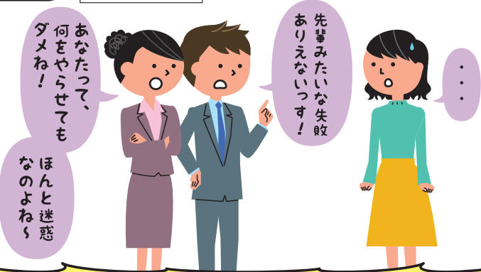
同僚や後輩による暴力や暴言も パワハラ です!

Q2 採用面接で、女性だけや業務に関係のない プライベートな質問 をするのはいいの?