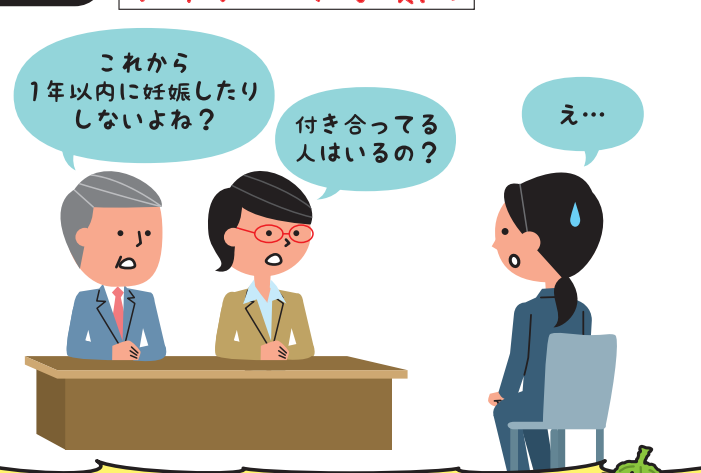
男女差別やプライバシー権の侵害にあたります!

Q2 採用面接で、女性だけや業務に関係のない プライベートな質問 をするのはいいの?