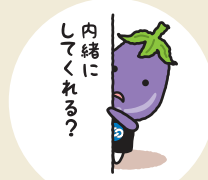
秘密は厳守します