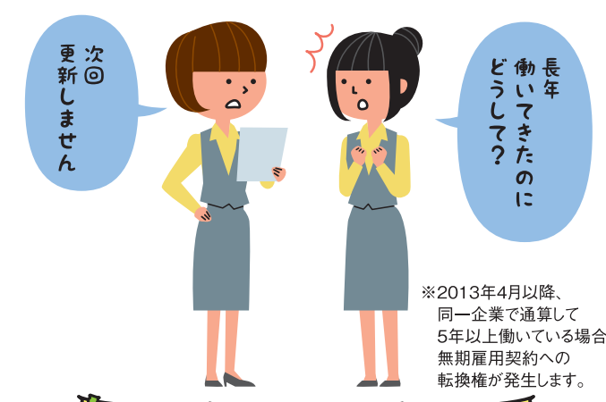
合理的な理由のない「雇止め」は 違法 の可能性があります!

Q3 長年、契約更新を繰り返してきたのに、突然 「更新しない」 って、アリなの?