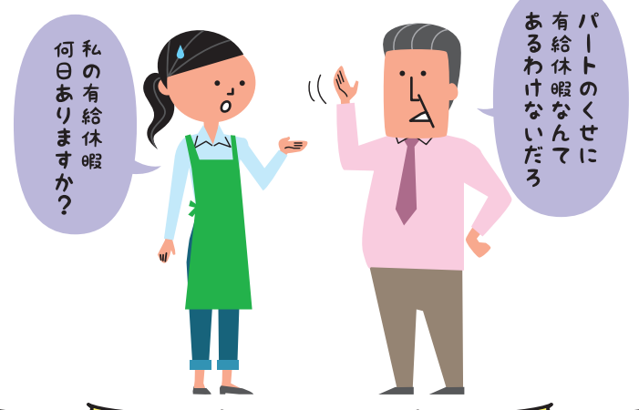
パートタイマーでも基準を満たせば 有給休暇 が付与されます!